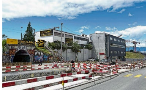
De gauche à droite: l'atelier d'usinage et de prémontage. L'atelier consacré à l'impression et aux autocollants. Le petit musée de Néon ABC. Et le bâtiment construit il y a huit ans à Lausanne.